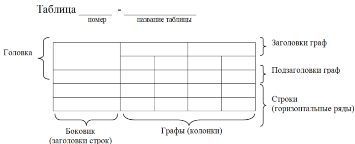
Рисунок 1 – Построение таблиц

математических и химических символов не допускается. Если цифровые или иные данные в какой-либо строке таблицы не приводят, то в ней ставят прочерк.